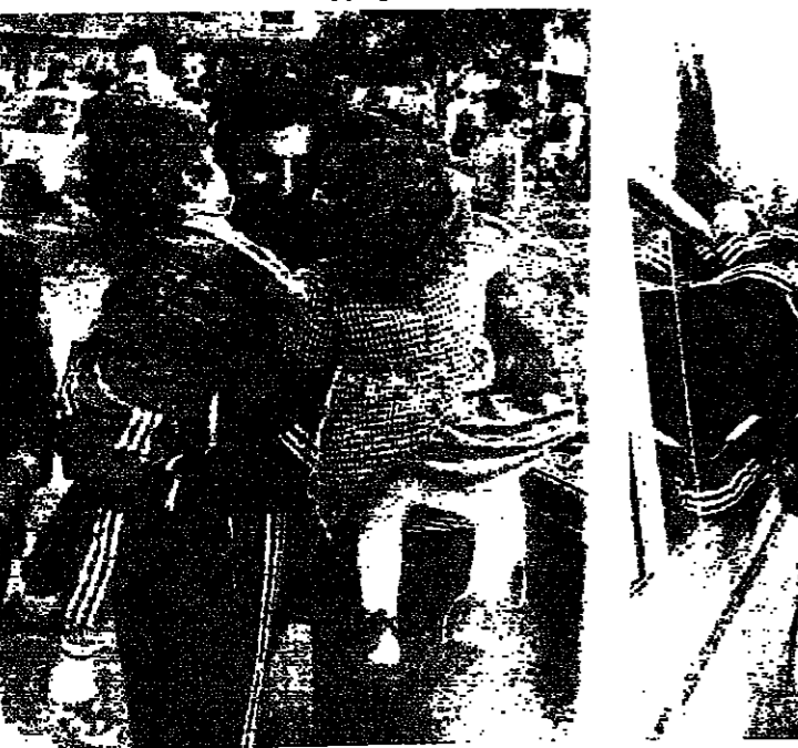
لقاء الامم والابناء